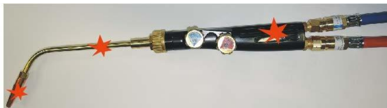
Rysunek 1: Urządzenia bezpieczeństwa zapobiegające wstecznemu zapłonowi, długotrwałemu wstecznemu zapłonowi i cofnięciu się płomienia.